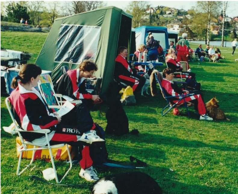
OODK på stevne i rad og rekke!

Derfor reiser vi hit og dit, både kort og langt, på forskjellige måter, men hvor målet er å konkurrere og hygge oss. Selv om vi har forventninger om å kunne vise at vi er bedre enn i tidligere konkurranser, flyr det alltid noen sommerfugler i magen som lurer på om forventningene vil bli innfridd, f.eks. om vi får det nappet vi trenger for å rykke opp i en høyere klasse? Og hvor flinke er konkurrentene blitt? Kan vi greie å hevde oss?