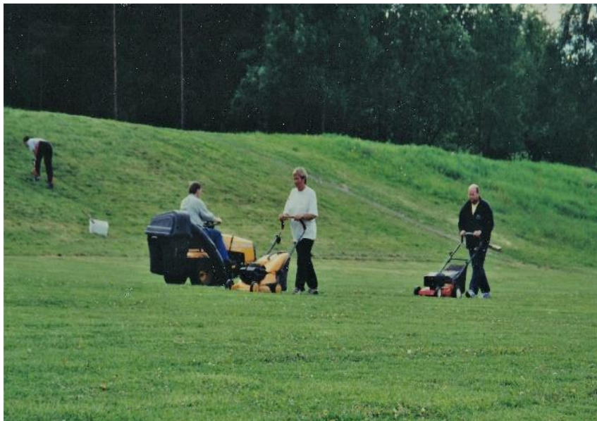
Også på Brekke gror gresset!

Alt var ikke bare idyll etter overtakelsen og oppsettingen av hytta. Særlig den ble hjemsoekt av tyver et par ganger, noen ville fyre av nyttårsraketter i hytta med resultat brann, og enkelte parkerte biler fikk ikke stå i fred i begynnelsen. Det ser ut som om besøkende er av den mer sportslige typen nå, som har vendt seg til klubbens tilstedeværelse i strøket.